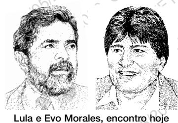
Lula e Evo Morales, encontro hoje

Estatal endurece com a Bolívia e ameaça recorrer à arbitragem da Corte de Nova York