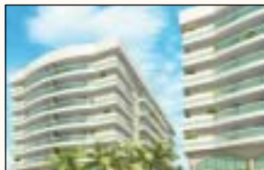
Conjunto Aquarius, Jacarepaguá