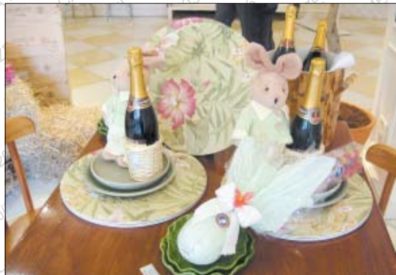
Os ovos de chocolate exigem cuidado na harmonização com as bebidas

desde que bem selecionado, também pode ser um acompanhante interessante para os ovos de Páscoa", diz Fernando Gabriel, embaixador da marca Johnnie Walker, da Diageo . Para ele o ideal é o Gold Label, que tem toques de mel, uva passa, creme de baunilha e sem os corriqueiros toques amadeirados e defumados, próprios da bebida e que não combinariam com o chocolate. Verdadeiros hedonistas congelam o Gold Label por 24 horas para liberar seus sabores suaves, o que pode torná-lo ainda melhor na companhia dos ovos de Páscoa. Há ainda outras possibilidades a serem exploradas como o Licor Grand Marnier, sugerido pela LVMH.